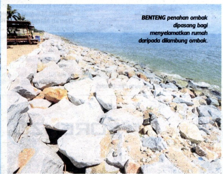
BENTENG penahan ombak dipasang bagi menyelamatkan rumah daripada dilambung ombak.