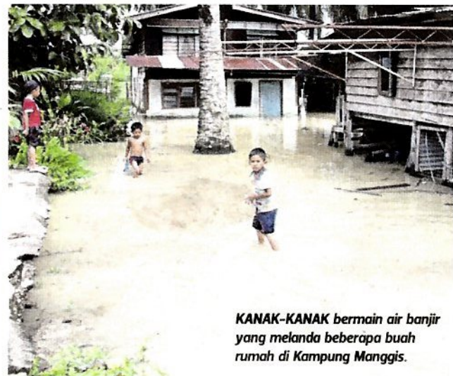
KANAK-KANAK bermain air banjir yang melanda beberapa buah rumah di Kampung Manggis.

salah banjir akibat air pasang besar ditempatkan di pusat pemindahan berdekatan. "Tindakan segera diambil MPSP dengan membersihkan sampah sarap di sungai yang terjejas akibat kejadian berkenaan," katanya.