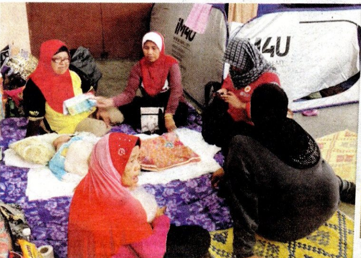
Keadaan mangsa banjir di balai rakyat selepas dipindahkan.

"Cuma apa yang kami minta supaya isu ini dapat diselesaikan segera sebab jika tidak penduduk kampung akan sentiasa risau bila berlaku hujan," katanya.