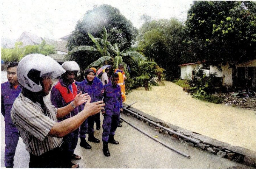
Kakitangan JPAM sentiasa bersedia sedia di pusat kawalan.