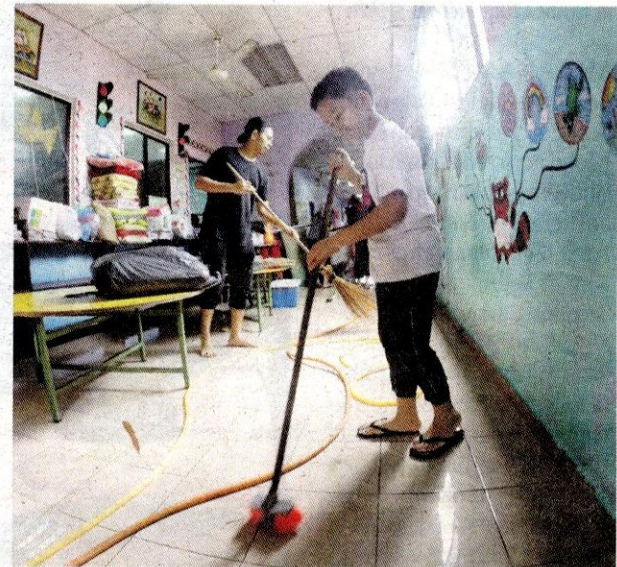
Kanak-kanak ini sibuk membersihkan Tadika Warisan Bistari.

Selain ibu muda itu, pemilik Tadika Warisan Bistari di Kampung Nelayan Teluk Bahang turut berkongsi pengalamannya.