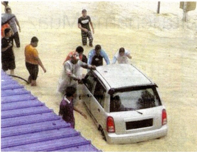
ORANG ramai membantu menolak sebuah kereta yang dimasuki air di Teluk Bahang.