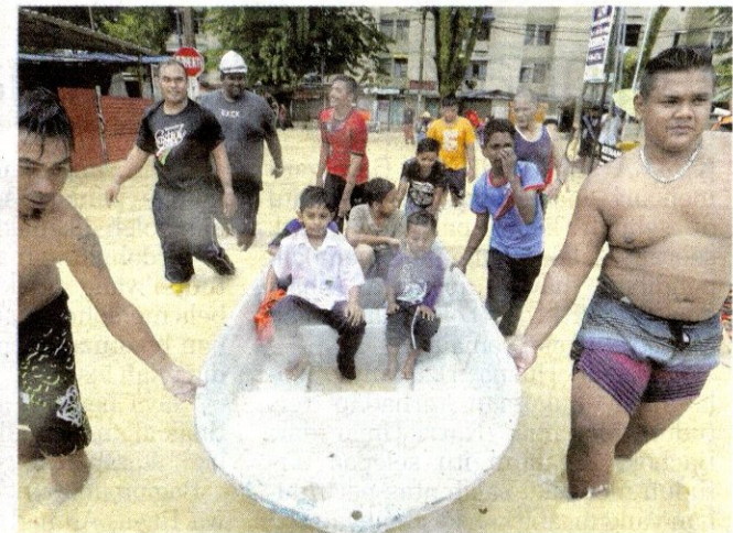
BEBERAPA orang penduduk membantu membawa kanak-kanak mangsa banjir kilat ke kawasan selamat.

Hujan lebat lima jam, lebih 200 rumah terjejas