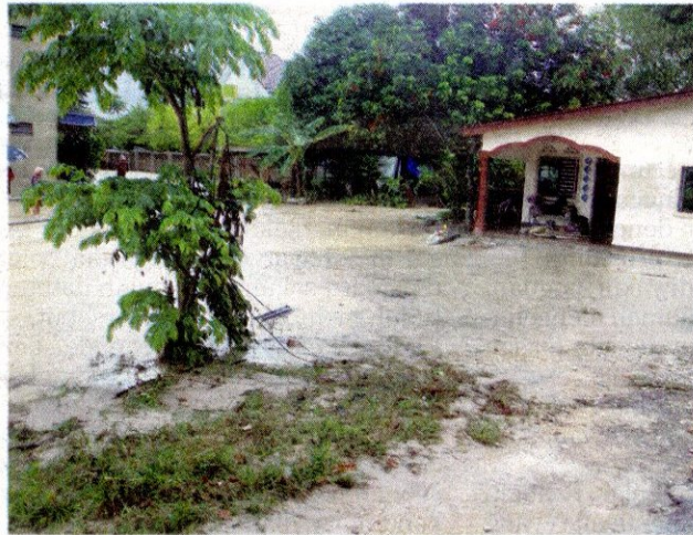
KEADAAN banjir kilat yang melanda beberapa kawasan perkampungan di Teluk Bahang semalam.