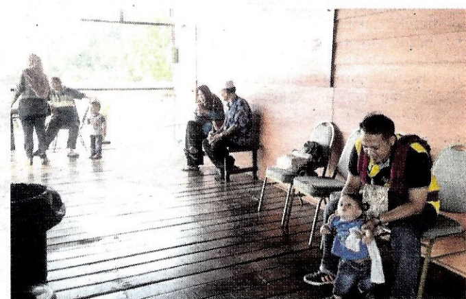
JUMLAH pengunjung yang semakin berkurangan di Pulau Orang Utan agak membimbangkan.

rangka pelbagai promosi termasuk memberikan 5,000 tiket percuma kepada beberapa akhbar terpilih sebagai satu usaha mengajak pembaca mengunjungi kepulauan ini.