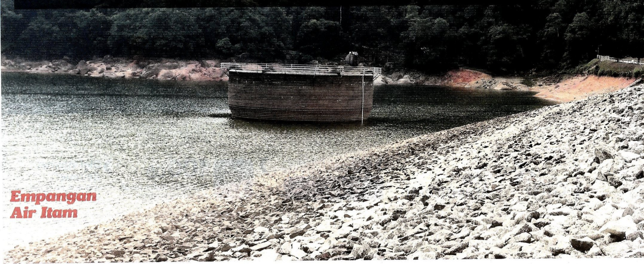
Empangan Air Itam

FAKTA Baki simpanan Empangan Kwong catat paras 11.96 peratus