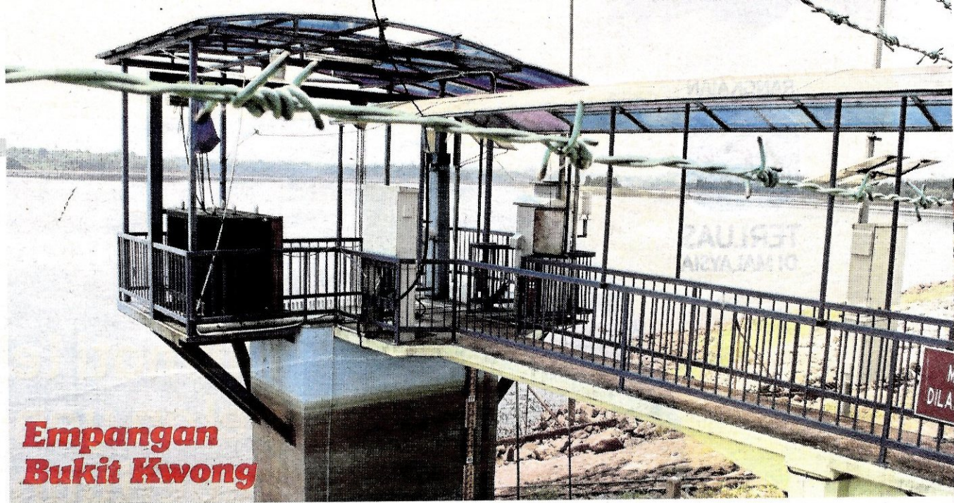
Empangan Bukit Kwong