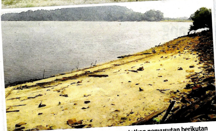
Empangan kolam Bukit Merah terus mencatatkan penyusutan berikutan kadar taburan hujan agak kurang sejak sebulan lalu.