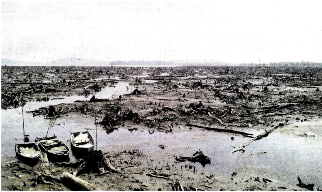
Tiga sampan nelayan yang terkandas tidak dapat turun ke empangan kolam Bukit Merah.