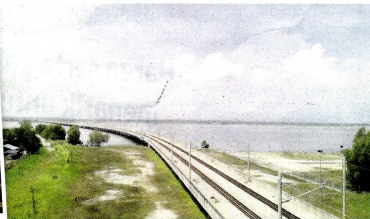
Keadaan empangan kolam Bukit Merah dirakam dari bahagian atas Kampung Balik Bukit, Gunung Semanggol.