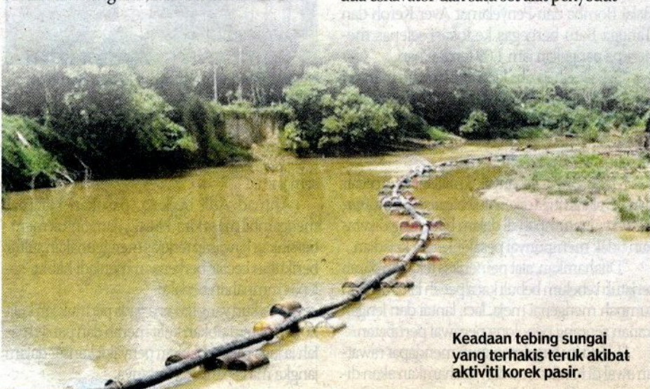
Keadaan tebing sungai yang terhakis teruk akibat aktiviti korek pasir.