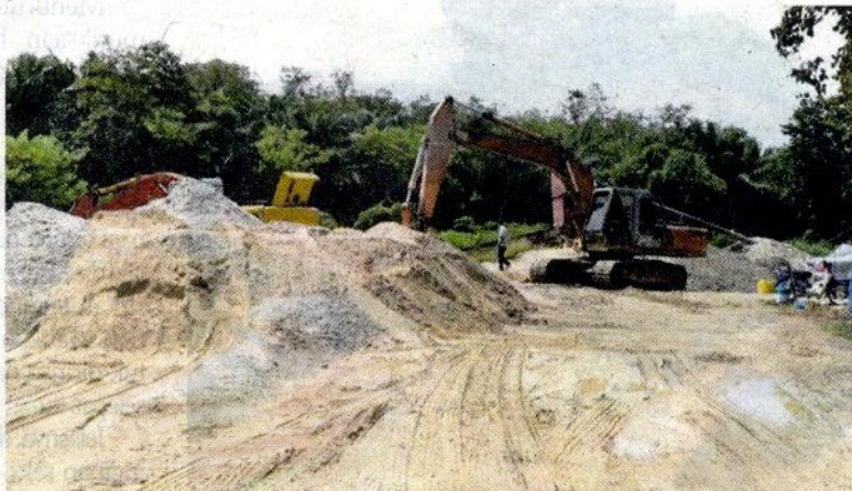
Pasir yang disedut dihimpunkan sebelum dijual kepada pihak tertentu.

"Selepas permit itu tamat, pemilik tanah bertindak mengusahakan sendiri aktiviti