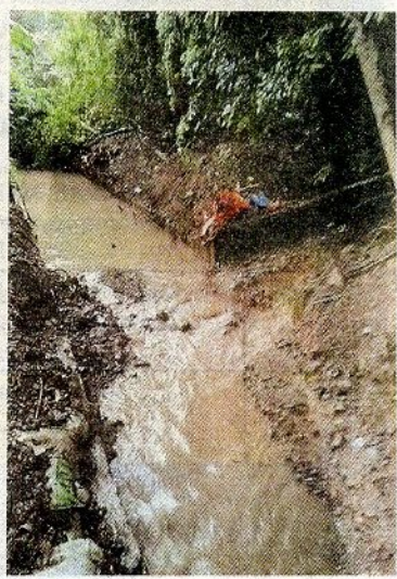
Kerja-kerja pembersihan longkang giat dijalankan.