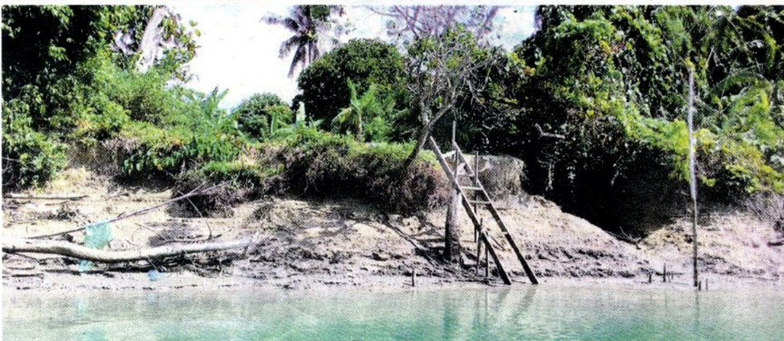
Jeti yang dibina penduduk rosak akibat masalah hakisan.