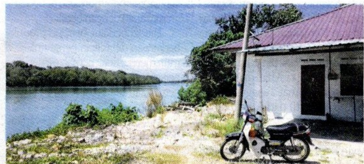
Sebuah rumah kelihatan begitu hampir dengan tebing sungai akibat masalah hakisan.