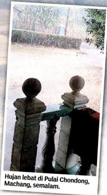
Hujan lebat di Pulai Chondong, Machang, semalam.