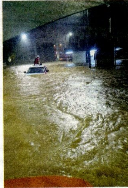
SEORANG pemandu teksi terpaksa naik di atas bumbung kenderaannya untuk menyelamatkan diri di hadapan pintu masuk Universiti Malaya, Kuala Lumpur.

“Pihak bomba juga telah mengerahkan seramai 13 pegawai dan anggota dari-