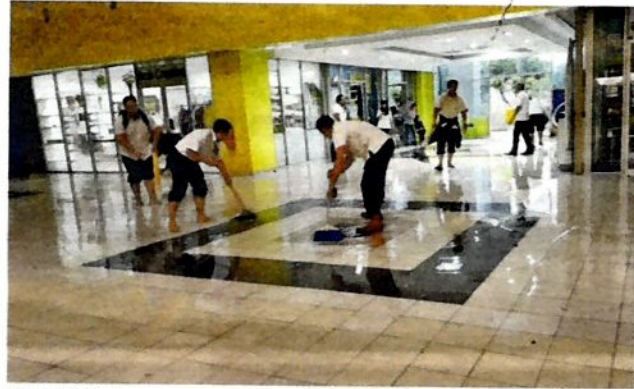
KELIHATAN beberapa peniaga mengeringkan lantai tingkat bawah pusat beli-belah Anggerik Mall yang digenangi air selepas hujan lebat di Shah Alam semalam.

Jelasnya, antara kawasan yang ditenggelami banjir kilat ialah di kawasan sekitar Seksyen 4