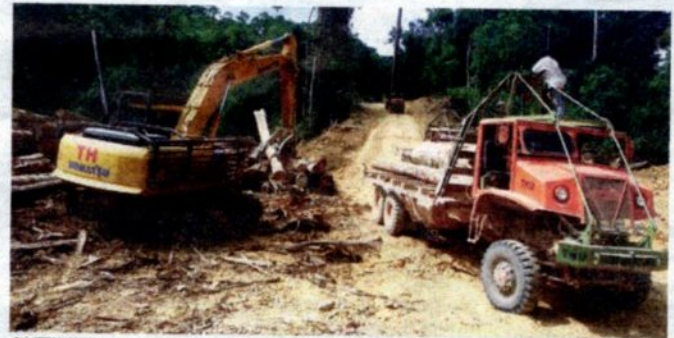
AKTIVITI pembalakan di Kampung Mat Daling dekat Ulu Tembeling, Jerantut dikatakan antara punca Sungai Pahang semakin kontang.

mungkin menyebabkan air sungai terpanjang di Malaysia itu semakin kering. Bagaimanapun beliau menegaskan, fenomena El Nino yang melanda negara sekarang merupakan punca utama kejadian tersebut.