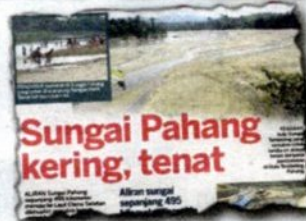
KERATAN Kosmo! 29 April 2016.

mungkin menyebabkan air sungai terpanjang di Malaysia itu semakin kering. Bagaimanapun beliau menegaskan, fenomena El Nino yang melanda negara sekarang merupakan punca utama kejadian tersebut.