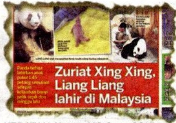
KERATAN Kosmo! 19 Ogos 2015.

Nama Nuan Nuan dicadangkan oleh seorang guru Bahasa Inggeris di Sekolah Menengah Kebangsaan Sultan Abdul Aziz,