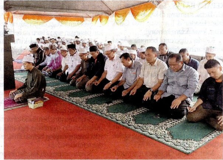
Kakitangan Sains dan pelajar Madrasah Tahfiz Al-Falah melakukan solat hajat di Empangan Sungai Terip, semalam.

“Tujuh empangan di negeri ini masih dalam paras baik dan mampu bertahan hingga Jun. Sungai Teriang, Sungai Muar dan Sungai Linggi masih di paras baik.