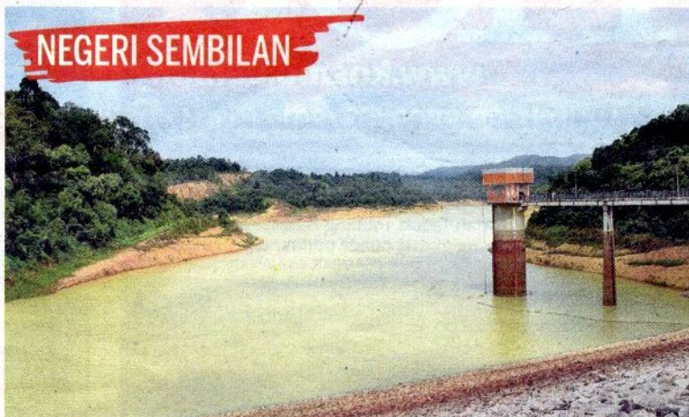
CUACA panas ekoran fenomena El Nino menyebabkan paras air di empangan Gemencheh kini di paras kritikal.

“Dua empangan di Johor dikategorikan antara paling kritikal.