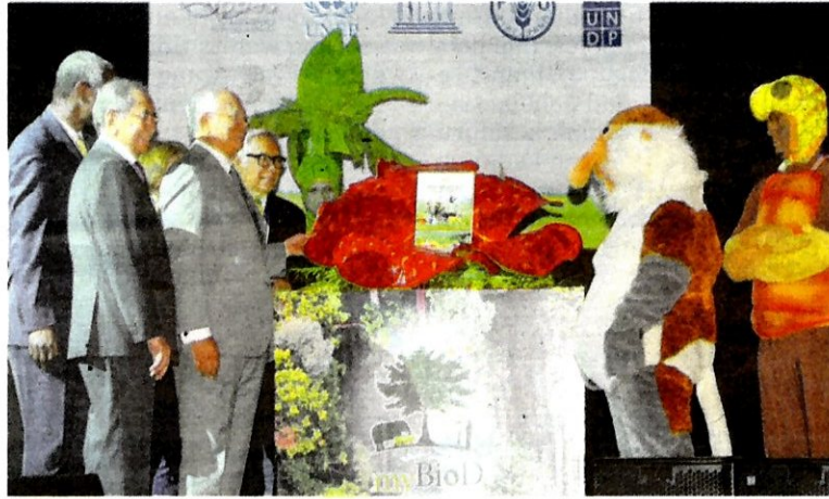
NAJIB (depan, tiga dari kiri) dan Wan Junaidi (depan, dua dari kiri) melancarkan Dasar Kepelbagaian Biologi Kebangsaan di Pusat Konvensyen Kuala Lumpur semalam.

“Semakan itu akan melengkapkan Malaysia di bawah Konvensyen Kepelbagaian Bio Pertumbuhan Bangsa-Bangsa Bersatu bagi melaksanakan matlamat