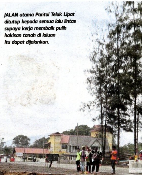
JALAN utama Pantai Teluk Lipat ditutup kepada semua lalu lintas supaya kerja membaik pulih hakisan tanah di laluan itu dapat dijalankan.

tenggelami air manakala bahagian belakang rumah pecah dibadai ombak.