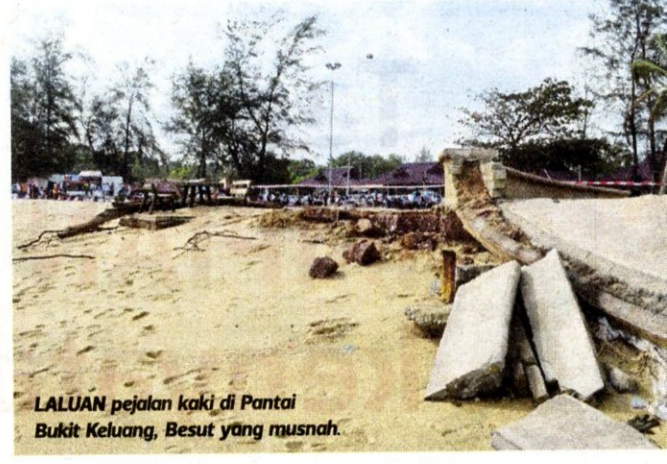
LALUAN pejalan kaki di Pantai Bukit Keluang, Besut yang musnah.