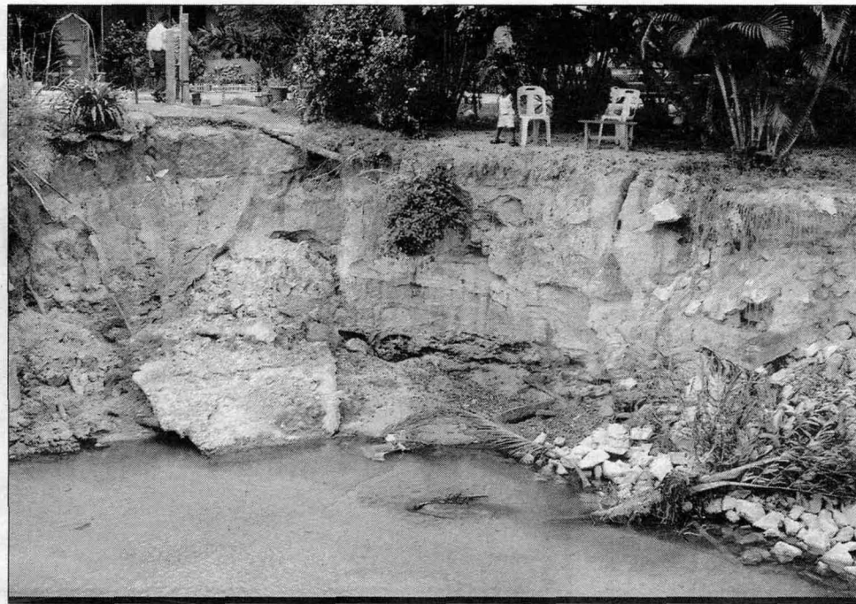
HAKISAN tebing sungai di Kampung Jenderam Hilir, Dengkil semakin teruk sehingga mengancam penduduk.