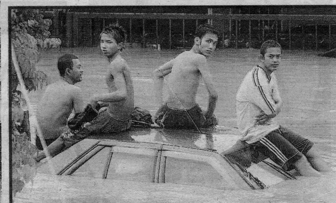
SELAMAT DIRI... sekumpulan pemuda menyelamatkan diri dengan duduk di atas sebuah kereta di Batu 4, Jalan Klang Lama.