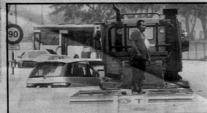
MACAM MANA INI... seorang pemandu trailer yang terperangkap terpaksa keluar dari kenderaannya.