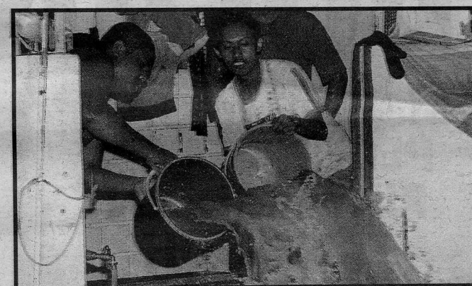
TIMBA... mangsa banjir di Jalan Klang Lama membuang air banjir dalam rumah.

Difahamkan, Skwad Penyelamat DBKL terpaksa memindahkan pelajar sekolah di sekitar Salak Selatan dengan menggunakan dua bot ke kawasan lebih selamat, sekali gus memudahkan mereka pulang ke rumah.