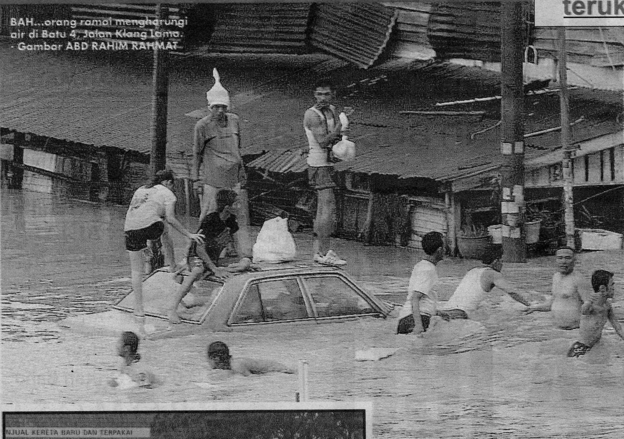
BAH...orang ramai menghargai air di Batu 4, Jalan Klang Lama.