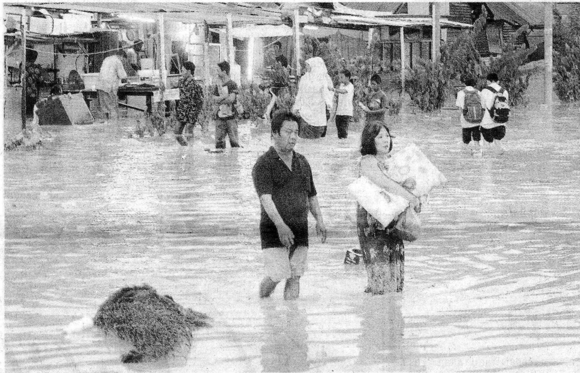
TERPAKSA REDAH: Penduduk Kampung Thambipillay di Jalan Klang Lama dinaiki air akibat limpahan Sungai Klang.

Chai, berkata banjir kilat disebabkan projek menaik taraf jalan di kawasan berkenaan hingga parit berhampiran tersumbat.