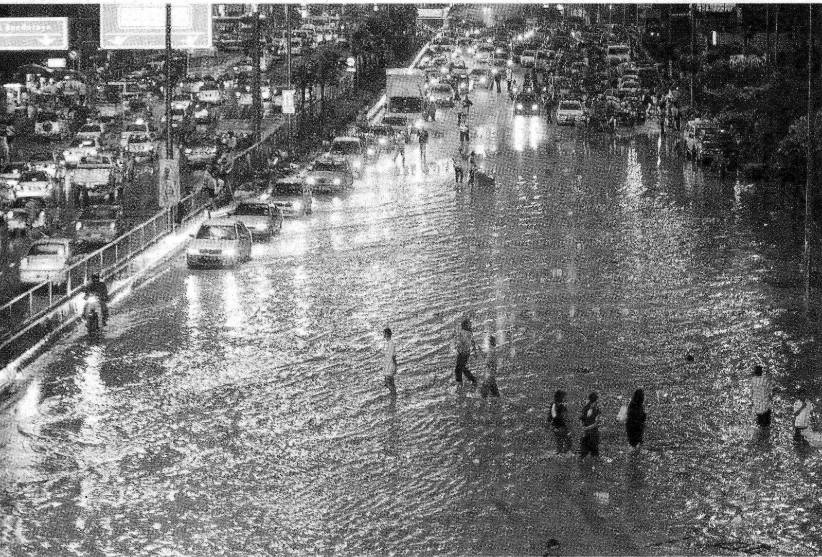
PERJALANAN TERKANDAS: Pemandu di Jalan Klang Lama terperangkap sehingga jam 7.30 malam tadi kerana laluan berkenaan tidak dapat dilalui.