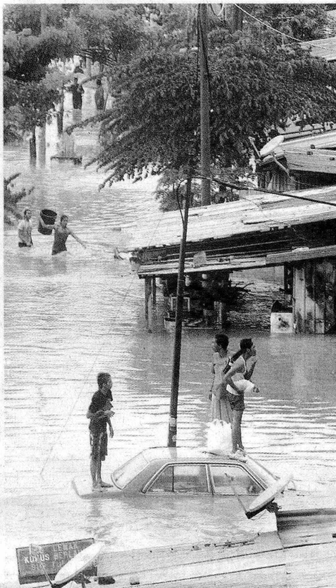
CARI TEMPAT SELAMAT: Beberapa rumah di Batu 4 Jalan Klang Lama terendam air.