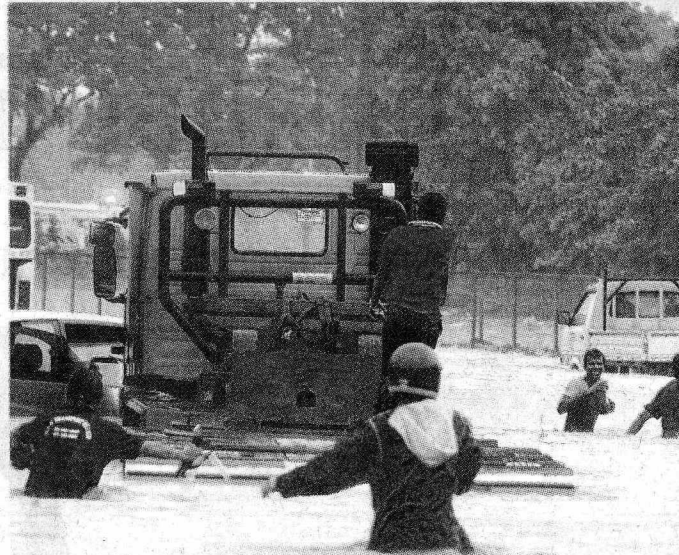
SELAMATKAN DIRI: Pengguna jalan raya menyelamatkan diri selepas kenderaan mereka terperangkap di susur keluar ke Kuala Lumpur, Lebuhraya Besraya.

"Pada masa sama kawasan berkenaan yang rendah menyebabkan air bertakung sebelum mengalir ke sungai berhampiran," katanya.