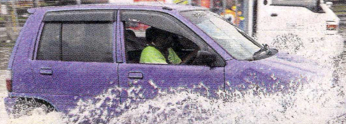
PENGGUNA jalan raya di Jalan Sungai Rasau, Padang Jawa meredah air ketika pulang dari kerja selepas kawasan tersebut dinaiki air dalam kejadian banjir kilat di Shah Alam, semalam.