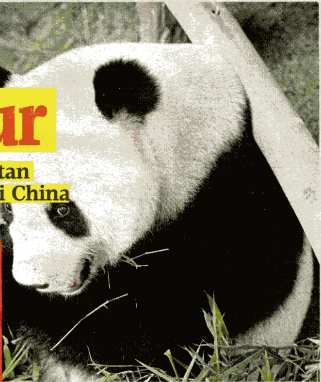
PANDA betina, Liang Liang.