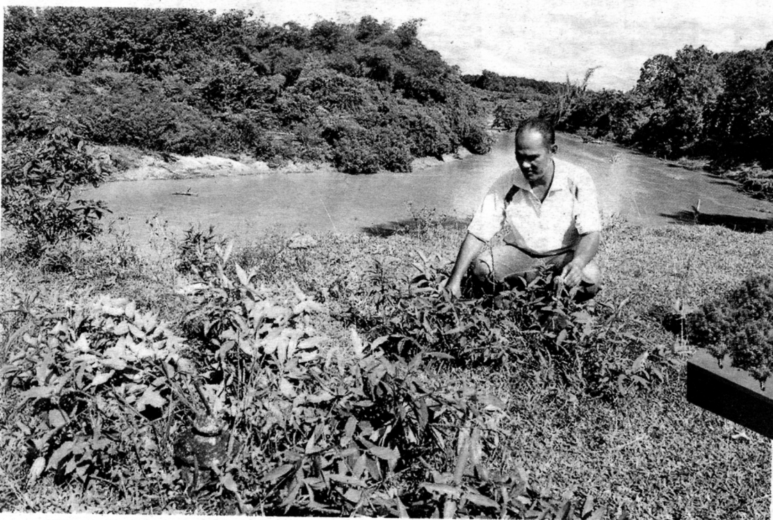
Deraman menunjukkan salah satu kubur yang berisiko dihanyutkan arus sungai pada musim tengkujuh kali ini akibat hakisan tebing Sungai Telemong di Kampung Imam Lapar.

"Jika tiada tindakan untuk mengatasinya, lebih ramai lagi akan kehilangan kubur ahli keluarga mereka," katanya.