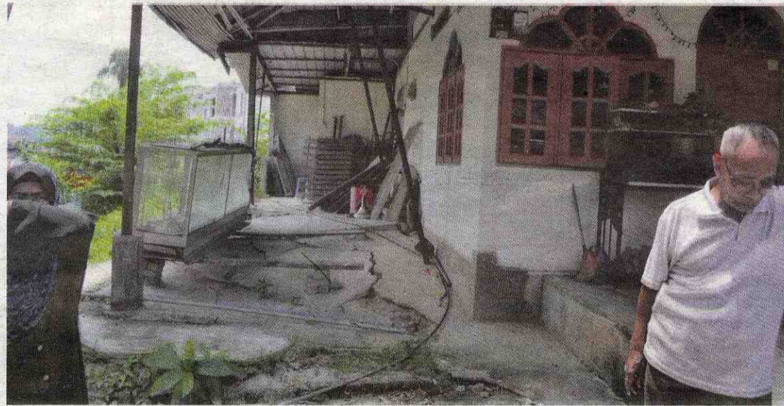
Bahagian tepi rumah penduduk sudah mula retak dan dibimbangi akan masuk ke dalam kawasan sungai.

Alawiyah Taha, 60, berkata, kemungkinan air sungai meresap ke tempat lain sehingga menyebabkan