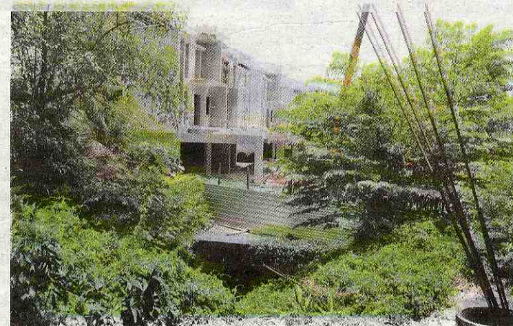
Dari jauh boleh dilihat pemaju perumahan mewah di belakang rumah penduduk cuba menutup sungai dengan konkrit.