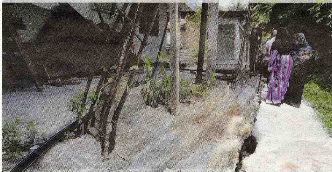
Penduduk menunjukkan rumah yang retak berlaku dalam tempoh dua hari ketika waktu hujan.