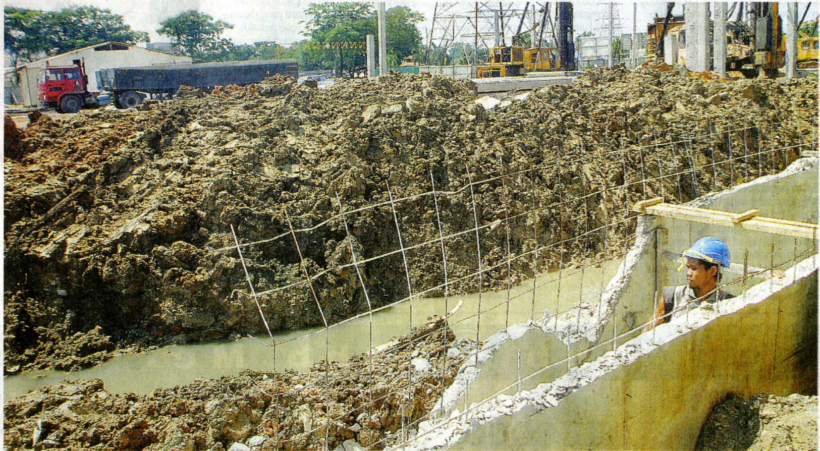
PUNCA MASALAH: Air tidak dapat mengalir ke longkang menyebabkan berlaku banjir apabila hujan lebat.

63 berkata, walaupun ada longkang di kawasan itu, ia belum mampu menampung kuantiti air terutama ketika hujan lebat menyebabkan air longkang melimpah masuk ke kediaman penduduk.