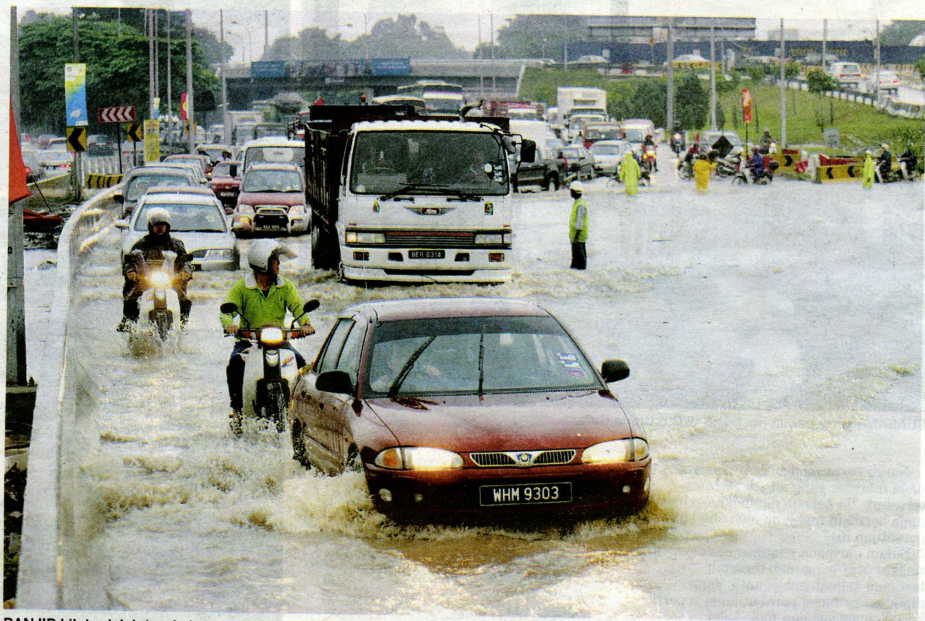
BANJIR kilat adalah tanda kerapuhan alam.

"Satu lagi contoh ialah semasa saya melawat Royal Academy of Architecture di Denmark. Saya ingat lagi ketika itu akhir Disember, musim sejuk, kira-kira jam 3 petang, hampir Maghrib. Di dalam sebuah bilik mesyuarat diadakan, lampu masih belum dipasang sebab cermin cukup terang dan mem-