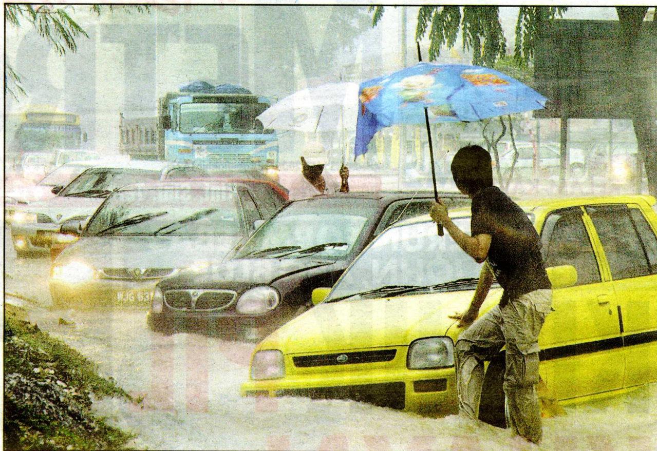
HABIS KERETA AKU... dua pemilik kereta cuba menyelamatkan kenderaan mereka dalam banjir kilat di Batu 5 1/2 Jalan Cheras, petang semalam.