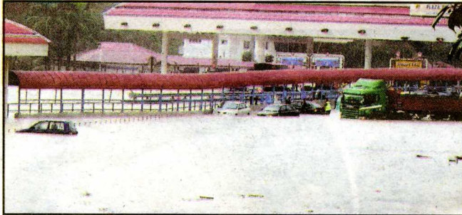
BAH... Lebuhraya Grand Saga dekat Plaza Tol Batu 9, Cheras digenangi air.