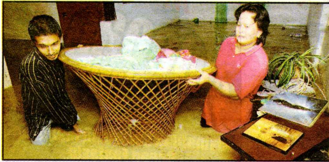
ANGKAT... dua penduduk Kampung Sungai Raya, Batu 9, Cheras menyelamatkan peralatan rumah mereka.