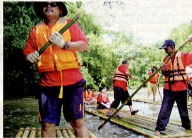
MENCABAR... aktiviti berakit di Sungai Pahang antara aktiviti sambutan Hari Air Sedunia peringkat kebangsaan.

Sambutan peringkat antarabangsa pada 22 Mac 2011