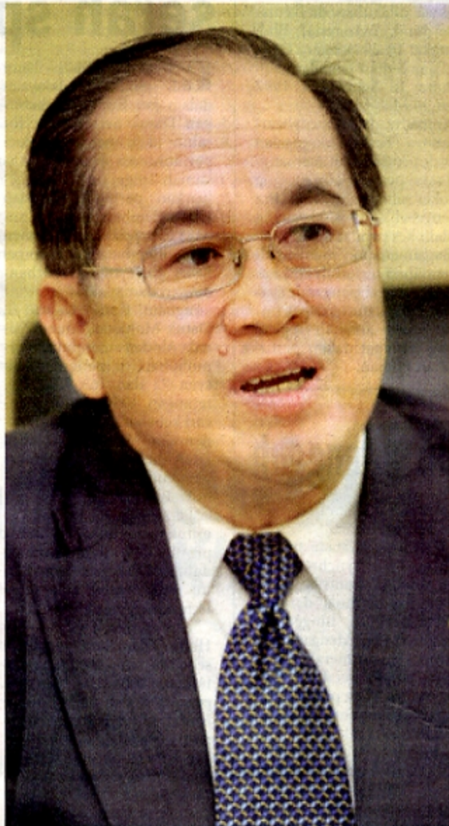
MENTERI Sumber Asli dan Alam Sekitar Datuk Seri Douglas Uggah Embas.

"Matlamat utama tema tahun ini ialah meningkatkan tumpuan dan menggalakkan kerajaan, pertubuhan bukan kerajaan, komuniti dan orang ramai untuk membabitkan diri secara aktif bagi menjayakan pengurusan bersepadu air di bandar melalui pendekatan undang-undang, garis panduan dan kesedaran semua pihak menguruskan keperluan air di bandar yang mencukupi berdasarkan kemampuan mendapatkan bekalan air di negara masing-masing. "Hari Air Sedunia yang disambut setiap 22 Mac