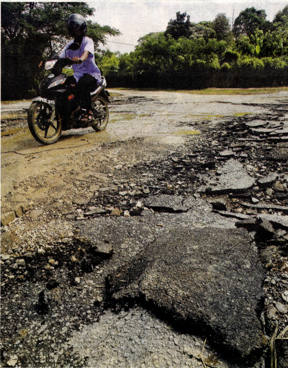
JALAN di Kampung Bukit Derang, Pokok Sena rosak teruk akibat banjir.

40 daripada 57 bilik gerakan yang dibuka di Perlis sejak seminggu lalu sudah ditutup selepas kawasan liputan masing-masing mulai surut.