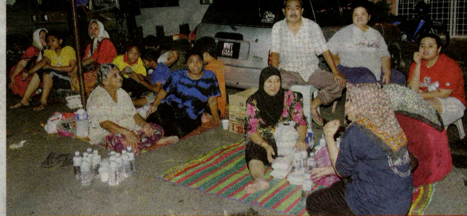
SEDIH...mangsa berehat di luar rumah selepas kejadian tanah runtuh di Seksyen 10, Wangsa Maju, malam tadi.