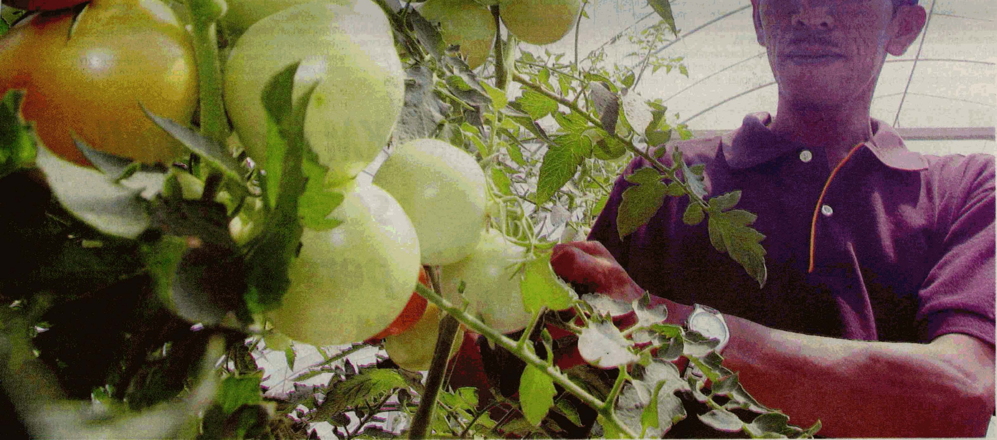
BERMUTU: Projek tanaman tomato diusahakan Hatta berbuah lebat.