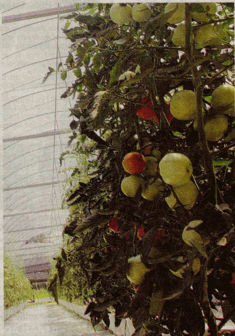
PERTANIAN MODEN: Kaedah fertigasi memerlukan pengurusan yang baik.