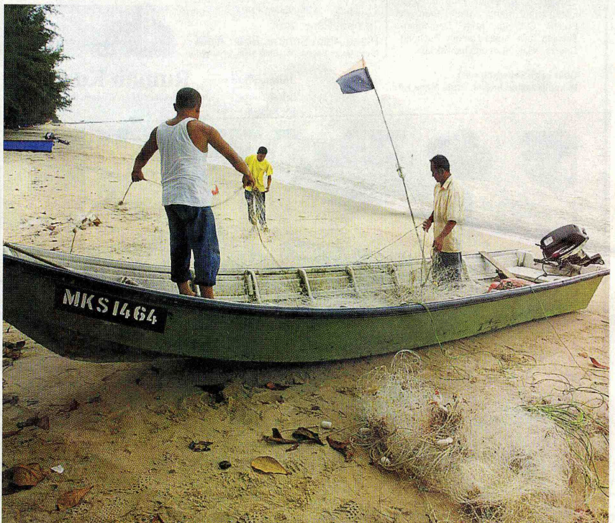
PANORAMA MENARIK: Pengunjung berpeluang melihat kegiatan nelayan di Pantai Puteri.