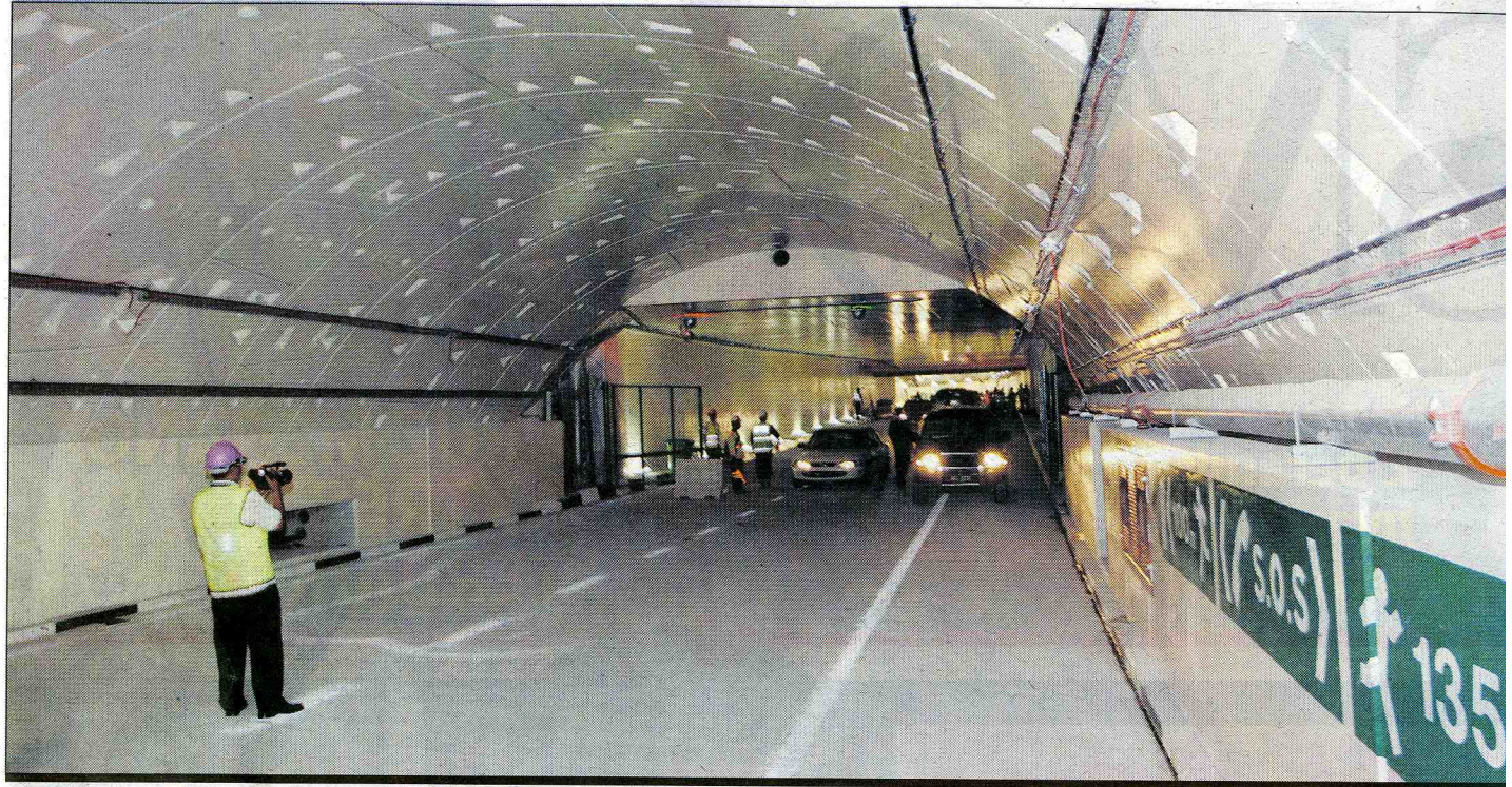
SATU daripada dua tingkat dalam terowong SMART yang akan dibuka kepada lalu lintas mulai Mac ini.