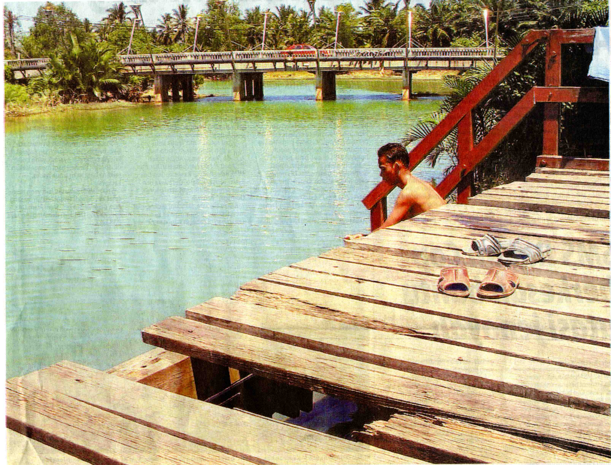
PEMBANGUNAN: Sungai Kesang yang tidak mampu menampung air juga akan dibaik pulih dengan memasang batu sangkar bagi mengelakkan banjir daripada berulang.