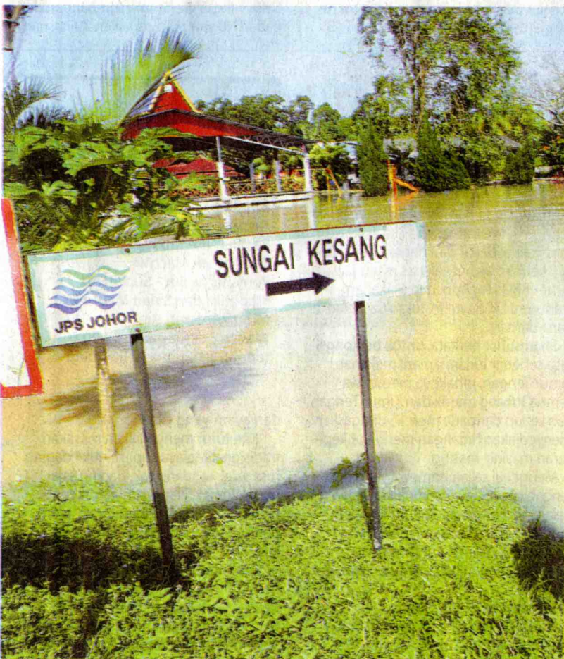
TENGCELAM: Keadaan banjir yang dikatakan berpunca daripada keadaan Sungai Kesang yang cetek akan dibaik pulih menjelang 2010.

“Kita sudah memohon sejumlah peruntukan daripada JKR untuk meningkatkan jalan yang pernah ditenggelami air sejauh enam kilometer di Sungai Rambai. Sekiranya banjir berlaku, jalan berkenaan akan sentiasa boleh digunakan berbanding kejadian sebelum ini,” katanya.