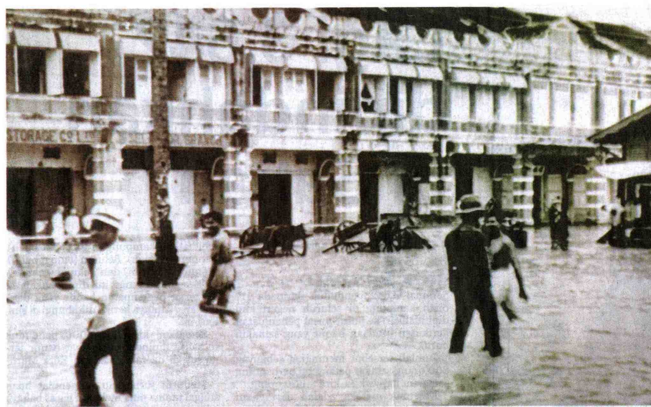
PENDUDUK meredah air yang hampir surut setelah 'Bah Besar' di Kuala Lumpur pada tahun 1926.