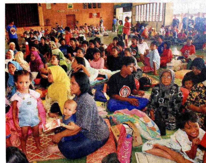
MANGSA BENCANA ALAM: Sebahagian mangsa banjir dipindahkan di pusat pemindahan di Sekolah Rendah Jenis Kebangsaan Cina Pu Sze di Skudai.