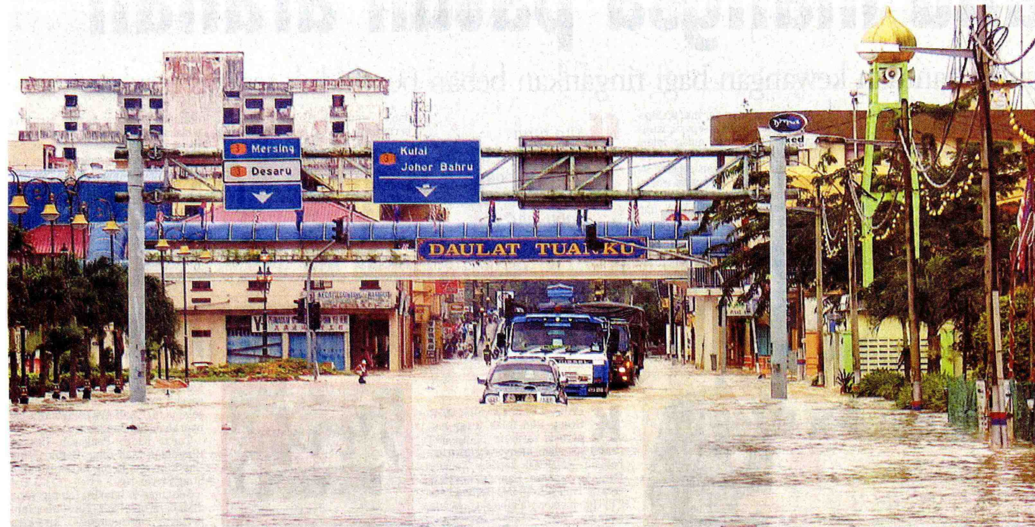
LALUAN UTAMA: Beberapa buah kenderaan cuba melalui Jalan Tun Habab di Kota Tinggi yang dinaiki air sejak malam kelmarin.

"Bagaimanapun, apabila berlaku banjir kali kedua, kita perlu menyemak semula nama keluarga supaya tidak dikira dua kali untuk menerima bantuan ini," katanya selepas merasmikan upacara pecah tanah Kompleks Sukan Komuniti Dewan Undangan Negeri