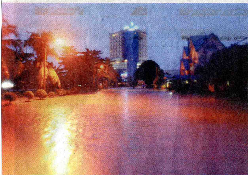
TAK NAMPAK JALAN: Keadaan jalan Kampung Melayu di bandar Kluang yang ditenggelami air selepas hujan berterusan.