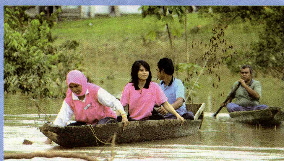
DAYUNG... Ketua Puteri Umno, Datuk Noraini Ahmad menaiki sampan untuk melihat kawasan yang dilanda banjir di Kampung Aur Sebarang, Bukit Ibam, Rompin.