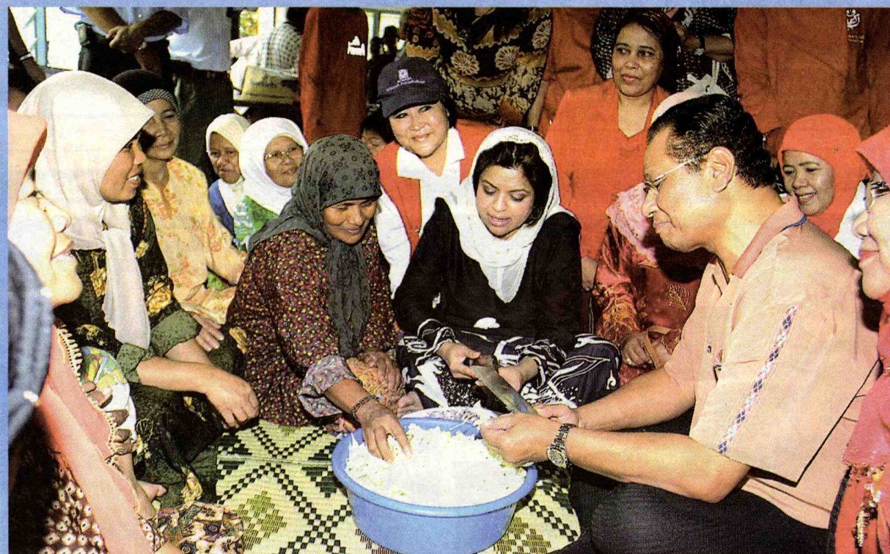
PRIHATIN... Menteri Pembangunan Wanita, Keluarga dan Masyarakat, Datuk Seri Shahrizat Abdul Jalil (duduk, tengah) diiringi Menteri Besar Johor, Datuk Abdul Ghani Othman membantu penduduk memotong sayur untuk dimasak ketika melawat mangsa banjir selepas menyampaikan bantuan di pusat pemindahan di Dewan Serbaguna Kesang Laut, Muar, Johor.