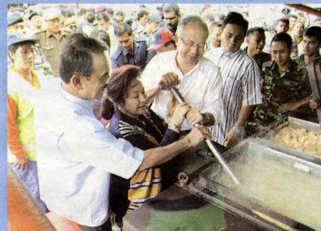
HULUR TANGAN... Timbalan Perdana Menteri, Datuk Seri Najib Razak bersama isteri Datin Seri Rosmah Mansor serta Ketua Menteri Melaka, Datuk Seri Mohd Ali Rustam membantu anggota tentera dari 3 Divisyen yang menyumbangkan khidmat menyediakan makanan kepada mangsa banjir di Sekolah Menengah Munsyi Abdullah, Batu Berendam, Melaka.