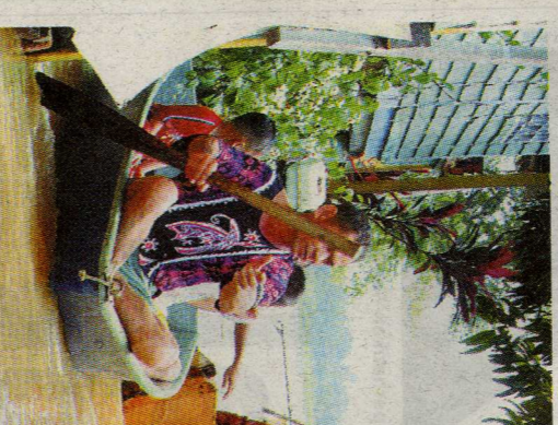
BELUM SURUT: Penduduk Kampung Pagar, Muar, terpaksa tinggal di atas bot untuk memudahkan akses ke rumah mereka yang masih ditenggelami banjir.