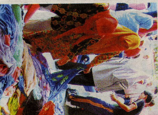
JUALAN MURAH: Orang ramai mengamuk pada harga antara RM10 hingga RM20 untuk membeli barang-barang keperluan asas.