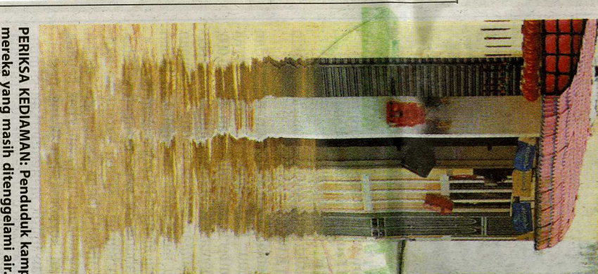
PERIKSA KEDIAMAN: Penduduk kampung Muar, Johor, memeriksa kediaman mereka yang masih ditenggelami air.