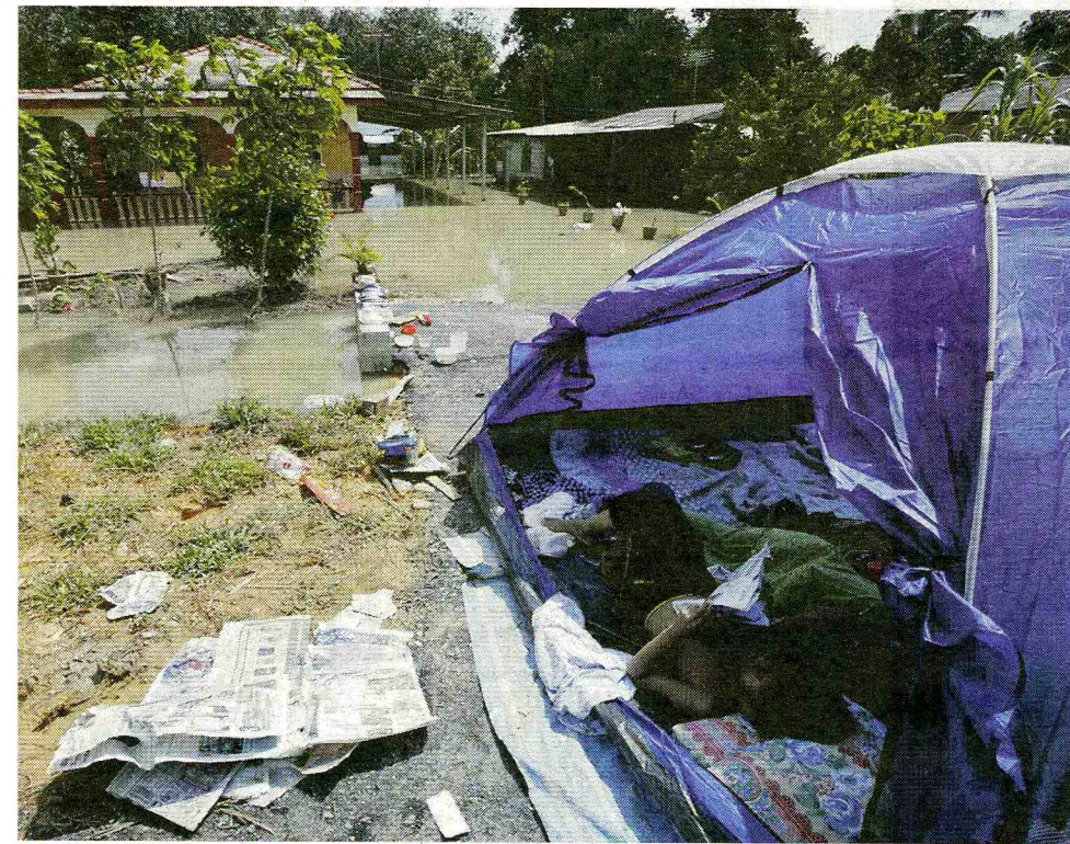
A kebersihan dan persekitaran semasa musim banjir.