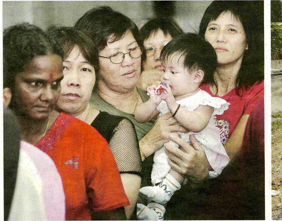
KANAK-KANAK atau orang dewasa sama risikonya dijangkiti penyakit sewaktu banjir.