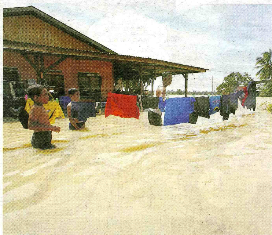
AIR banjir biasanya mengandungi pelbagai bahan bertoksik yang berbahaya.