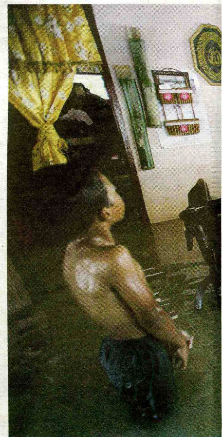
AIR yang tercemar mengandungi mikro-organisma yang boleh menembusi tubuh melalui luka atau calar.

Menurut laman web Kementerian Kesihatan Malaysia, antara cara mengelakkan risiko mendapat penyakit berjangkit sewaktu musim banjir adalah sentiasa minum air dan makanan yang sudah dimasak, elakkan makanan mentah, basuh tangan sebersih-bersihnya, dapatkan suntikan yang diberikan dan jagalah kebersihan diri serta persekitaran.