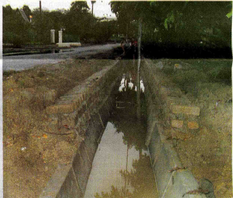
DALAM PEMBINAAN: Longkang baru bagi mengatasi banjir kilat.

Beliau berkata, peruntukan itu termasuk kos membuat kolam takungan di kawasan yang sering dilanda banjir kilat, malah kolam seumpama itu yang dibina di Sungai Putat terdahulu akan dijadikan contoh bagi kolam takungan banjir yang akan di bina bersebelahan Taman Merak Mas di tanah milik Perbadanan Tanah Adat Melaka (Pertam).