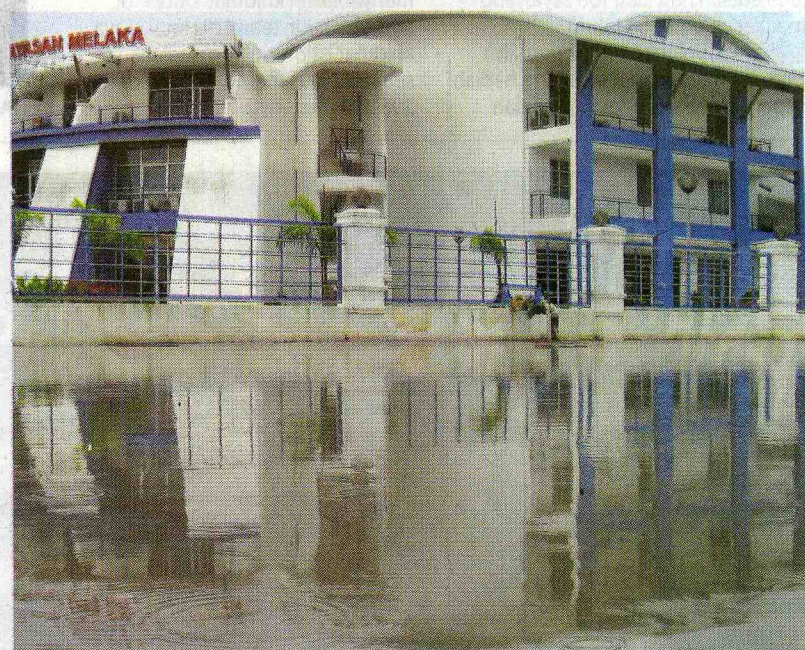
TIDAK TERKECUALI: Pekarangan bangunan anak syarikat kerajaan negeri, Institut Bio-Teknologi Melaka turut digenangi.