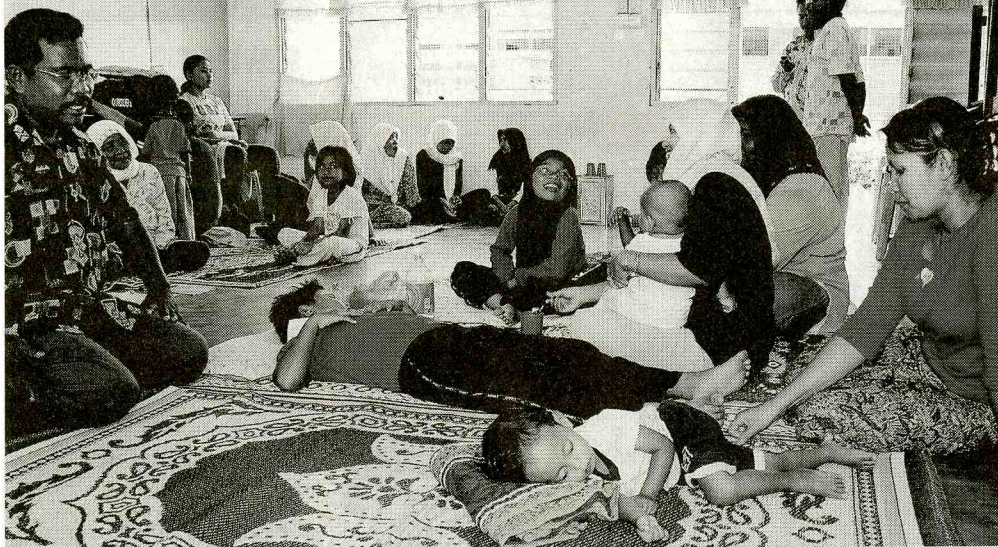
REHAT... sebahagian mangsa banjir yang ditempatkan di pusat pemindahan di Sekolah Kebangsaan Pengkalan Besar, Tangkak, Muar.