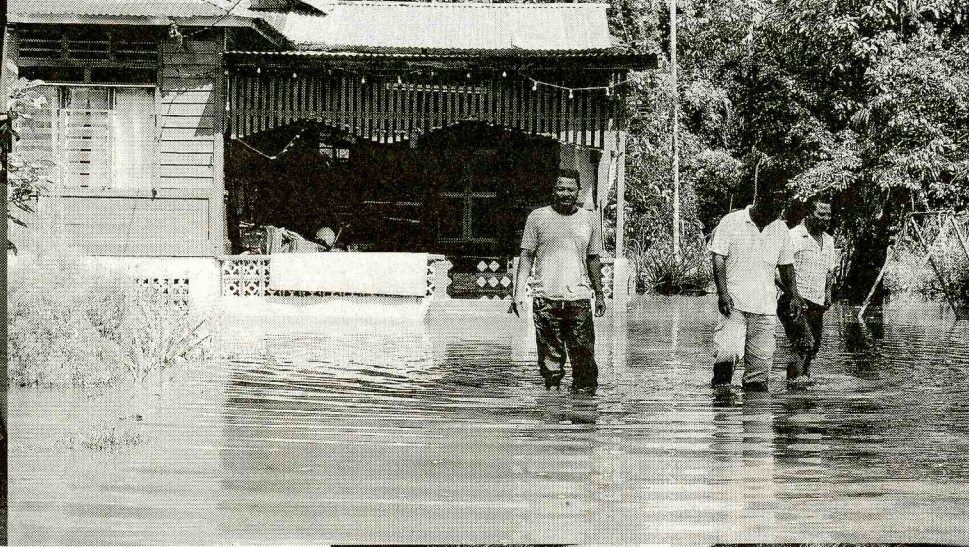
MELIMPAH... paras air naik mendadak di Kampung Teluk Rimba, kelmarin.