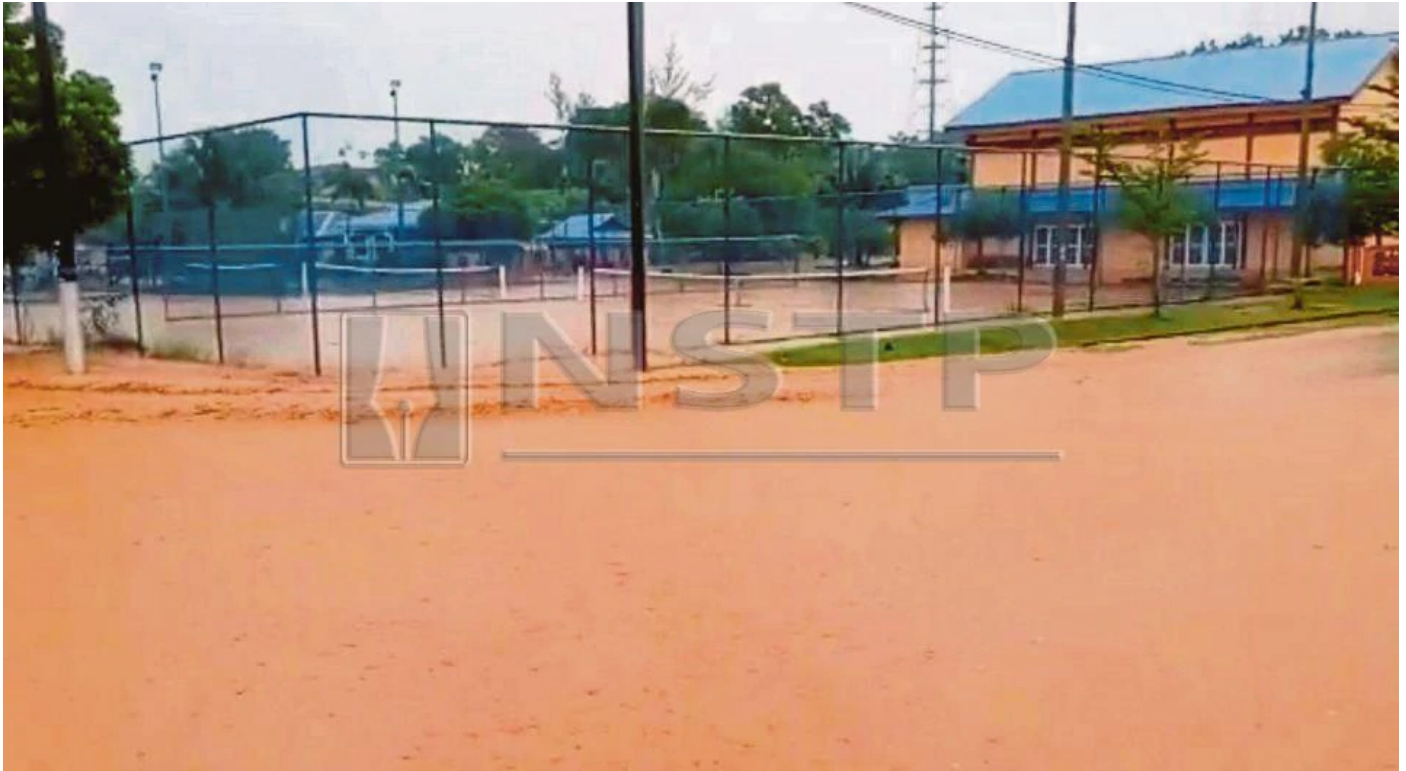
KEADAAN banjir lumpur yang melanda Bandar Bukit Besi didakwa penduduk akibat daripada kolam takungan kerja pelombongan di situ yang dioercayai pecah.