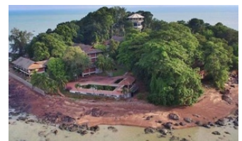
Kawasan pendaratan penyu karah