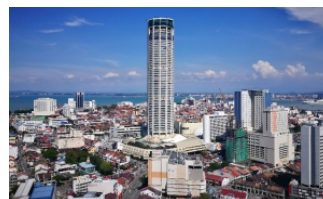
Pulau Pinang komited untuk terus