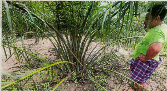
PENDUDUK melihat pokok sawit yang musnah akibat aktiviti perlombongan emas.

"Rumah saya berdekatan kawasan lombong, kira-kira 100 meter saja. Baru-baru ini musim hujan lebat habis tanaman saya ditenggelami lumpur akibat limpahan air Sungai Sai. Sepatutnya mereka (pemilik lombong) menimbus lombong mereka kembali, bukan biarkan," katanya.