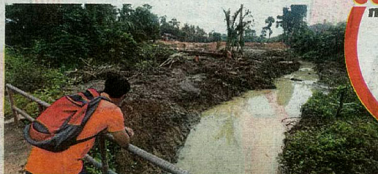
SUNGAI Sai di Kampung Gua turut tercemar.

Tindakan itu sekali gus mengundang bahaya kepada penduduk yang terpaksa memikirkkan keselamatan anak mereka yang sering memancing di kawasan bekas lombong selain ancaman banjir kilat.