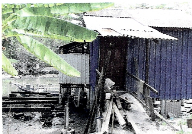
PENCEMARAN di Sungai Nipah dan Sungai Keluang, Bayan Lepas juga dikatakan berpunca daripada sikap penduduk yang tidak mengendahkan soal kebersihan.