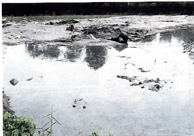
AIR Sungai Keluang di Bayan Lepas bukan sahaja berwarna hitam tetapi berbau busuk ekoran pembuangan sisa sampah sarap yang dilakukan beberapa individu yang tidak bertanggungjawab.