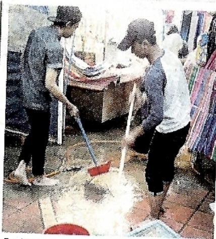
Ponlaga membersihkan tapak jualan terjejas.