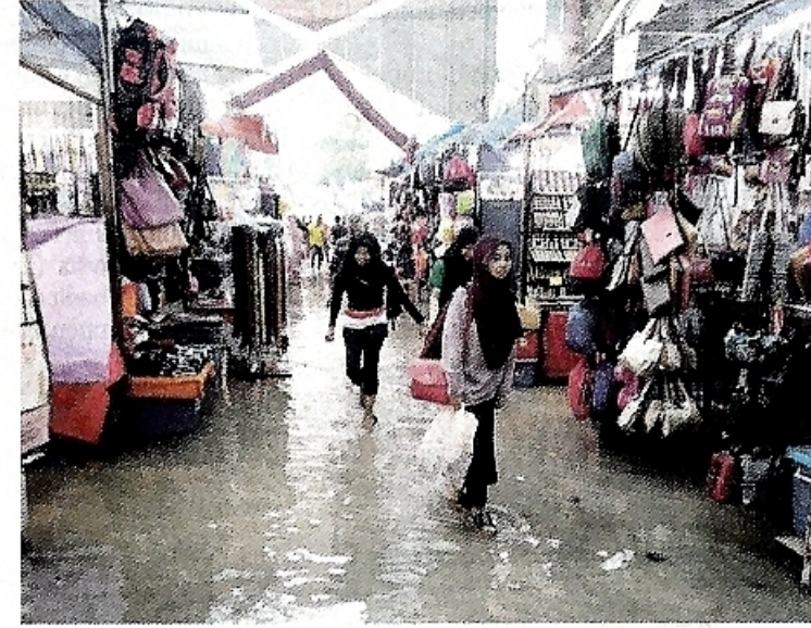
Kawasan bazar Jalan Melayu Masjid India turut dinaiki air.