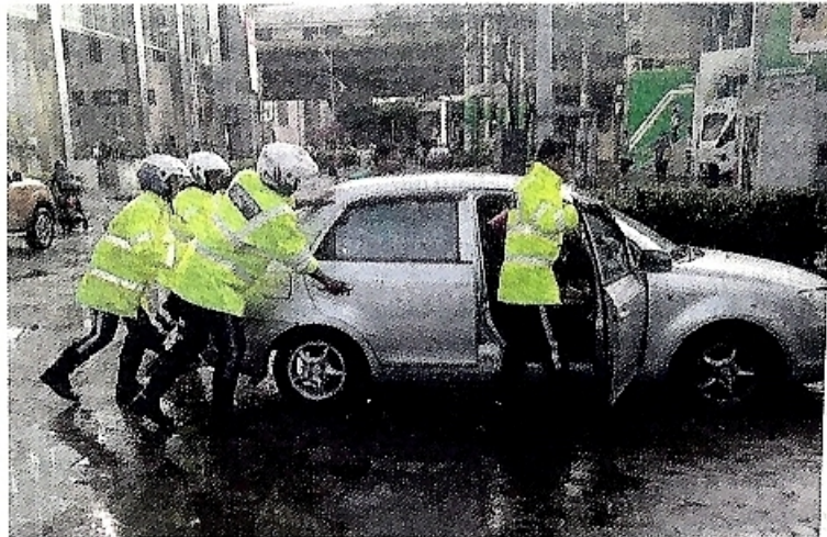
Petugas DBKL membantu menolak kereta yang terperangkap dalam banjir kilat.