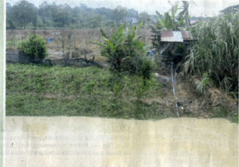
PENCEMARAN air sungai Somp turut menjejaskan tanaman pekebun kecil di sepanjang sungai berkenaan.