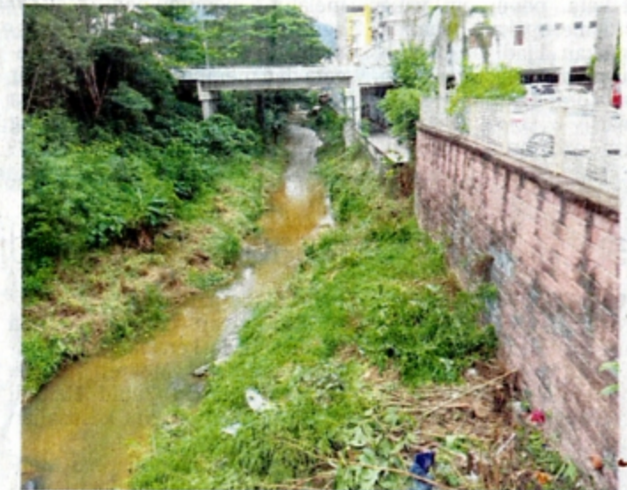
SEMAK samun sepanjang Sungai Jinjang berdekatan One Selayang dan 162 Residency, Selangor telah dibersihkan JPS Daerah Gombak.

Penduduk merayu supaya JPS menyegerakan kerja selenggaraan ini kerana ia bukan sahaja memburukkan pemandangan, lebih membimbangkan ancaman haiwan berbisa seperti ular yang menjadikan kawasan itu sebagai habitat.