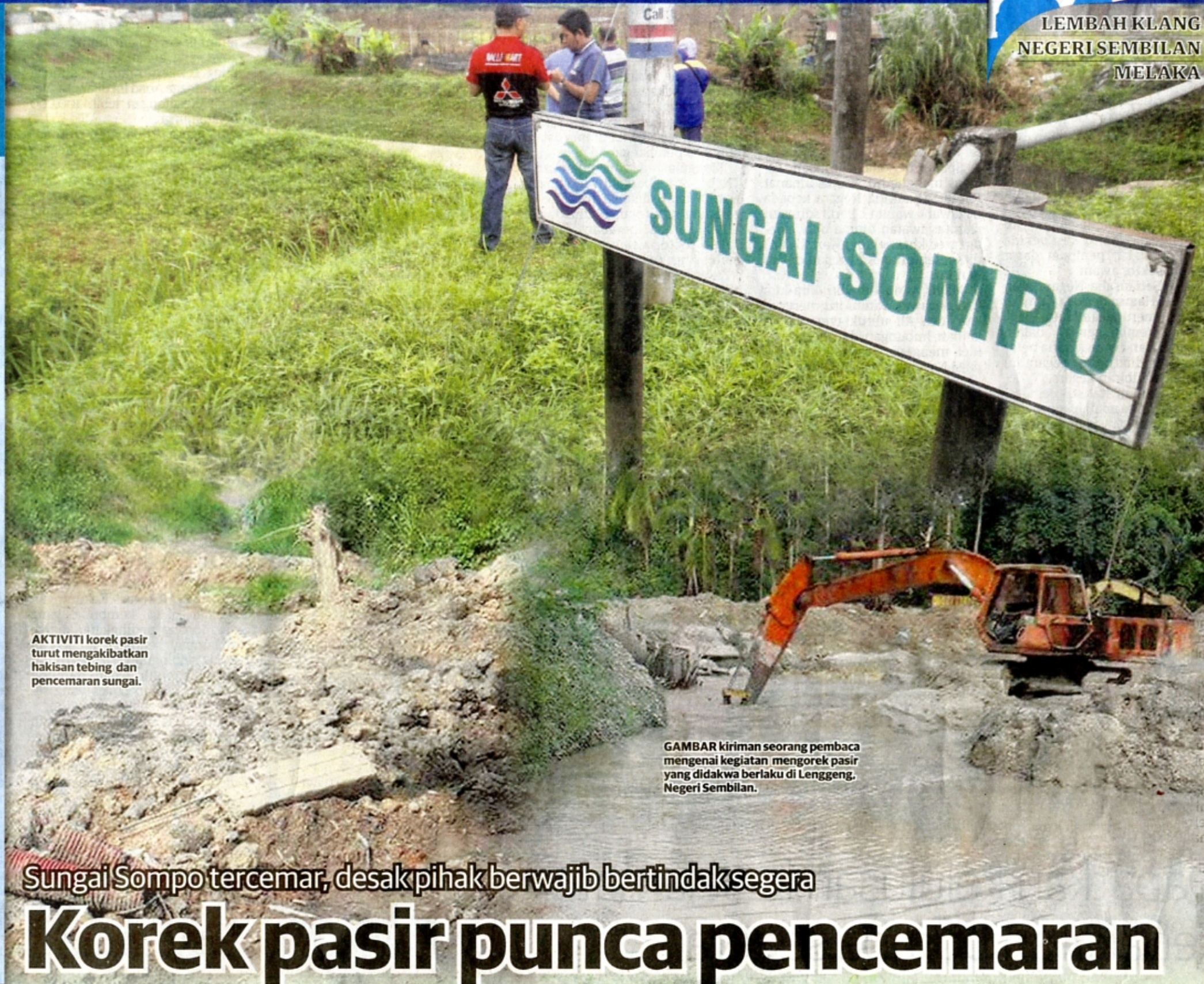
AKTIVITI korek pasir turut mengakibatkan hakisan tebing dan pencemaran sungai.