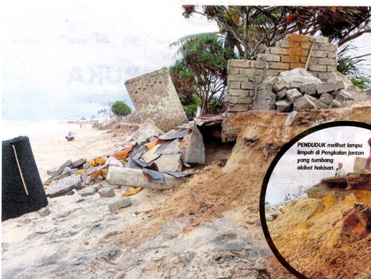
PENDUDUK melihat lampu limpah di Pengkalan Jantan yang tumbang akibat hakisan.

FAKTA Masalah hakisan di sepanjang pantai semakin parah