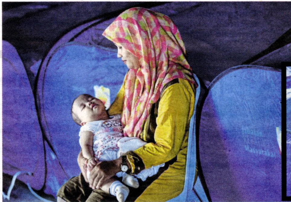
SEORANG penduduk bersama bayinya di pusat pemindahan di Dewan Serbaguna Kampung Tok Muda, Kapar, semalam.

“Dalam kejadian pertama September lalu, kami tidak diberikan amaran dan tidak sempat menyelamatkan perkakas elektrik. Kini, kami segera berpindah selepas menerima arahan pihak berkuasa apatah lagi rumah